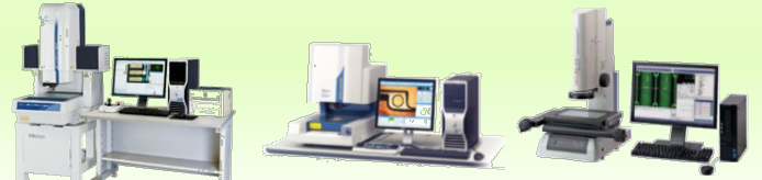
クイックビジョン